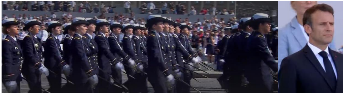
14 juillet : passage des écoles du SSA devant la tribune présidentielle