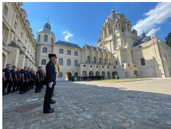
Cérémonie de remise de décorations de la BSPP