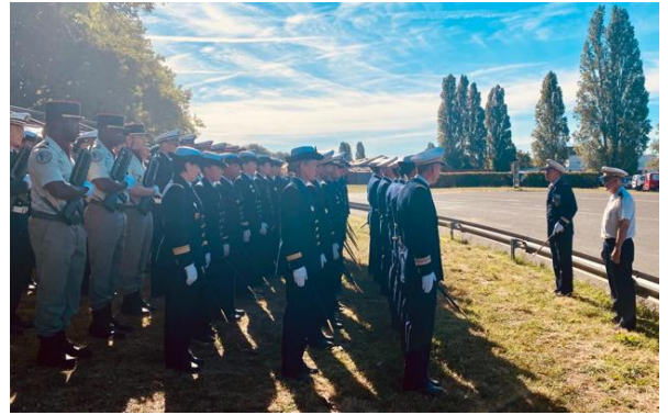
Visite du Directeur central du SSA

Les élèves des trois écoles se sont montrés particulièrement rigoureux à la tâche et ont parfaitement défilé, faisant toute la fierté du Service de santé des armées.