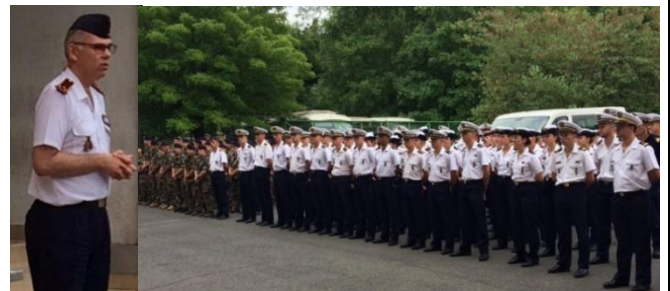
Encouragements du Directeur de l'Ecole