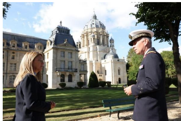
Le Directeur présente l'Histoire des lieux à Madame le Ministre

créatrice de mode en 2008, organisait un défilé de sa maison de haute-couture à Paris, après avoir participé aux Fashion Week de Londres et de New York. « La Fashion Week de Paris "est la plus en vue, c'est une manière d'être validée comme une marque qui a une vraie identité créative" » soulignait l'Institut Français de la Mode sur FranceInfo . Parmi les célébrités présentes, Anna Wintour, rédactrice en chef de Vogue , l'actrice Eva Longoria et bien sûr le couple Beckham et leurs enfants.